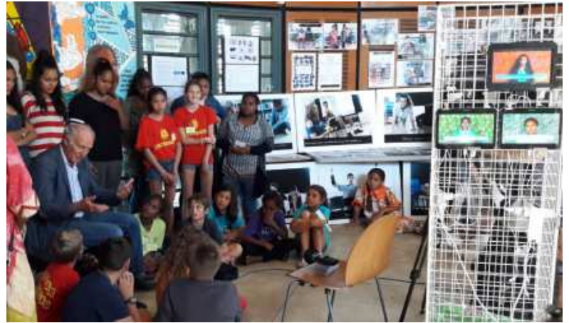
Monsieur le Vice-Recteur, intéressé par l'exposition commune aux collèges Baudoux et Mariotti et au Lycée Escoffier : les vidéos, tableaux, photographies avaient pour but de promouvoir l'égalité filles-garçons avec de l'art.

Le collège a présenté trois projets : des élèves de 4e présentaient le projet «Devoir de mémoire», le CDI présentait l'atelier Médias, et la classe de 4e2 présentait leur exposition numérique vidéo sur l'égalité filles-garçons.